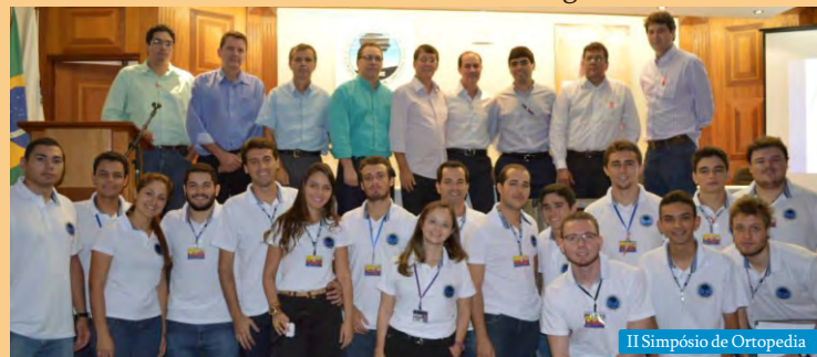
II Simpósio de Ortopedia

Dentre os eventos realizados durante o semestre estão o II Simpósio de Ortopedia, Dia Mundial da Saúde, I Simpósio da Liga de Humanização Plantão da Palhaçada, curso sobre Parada Cardíaca, Dia Mundial da Voz, I Simpósio de Emergências Clínicas, I Jornada Diabética e I Simpósio de Radiologia.